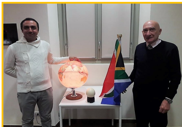
Immagini della serata